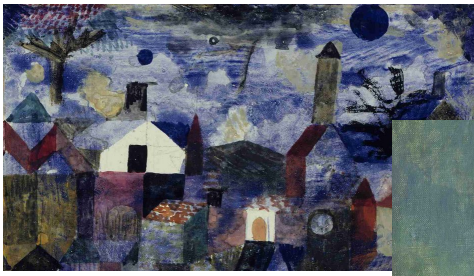
Paul Klee Landschaft in blau (1917)